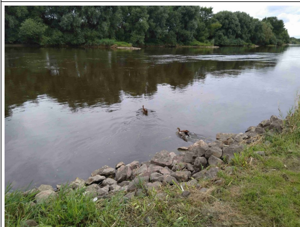
Ist doch nicht der Nil, was suchen die Gänse hier!