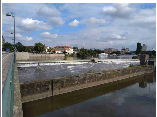
Hameln, fast zuhause!