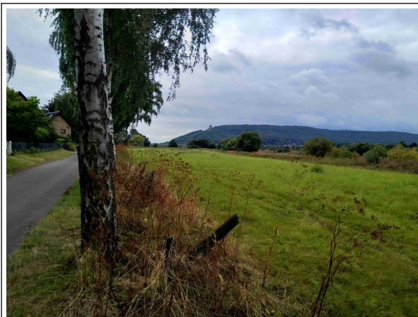
Porta in Sicht